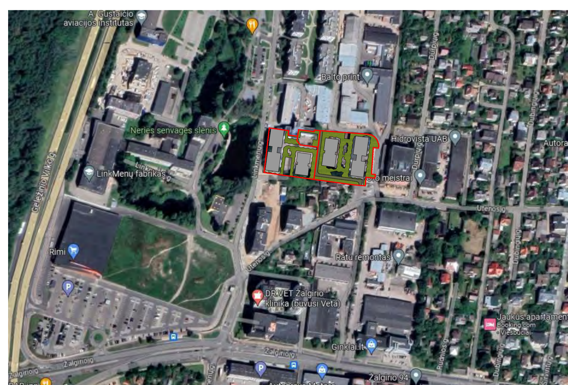
SITUACIJOS PLANAS M 1:2000

PROJEKTO IDĖJA: ŠIAUDŲ SODO INTERPRETACIJA - "LINKMENŲ SODAI" ŠIAUDINIAI SODAI YRA TAUTIŠKA LIETUVIŲ PAPROTINĖS, DEKORATYVINĖS DAILĖS RŪŠIS. TAI YRA GRIEŽTŲ GEOMETRINIŲ FORMŲ DIRBINIAI IŠ ŠIAUDŲ. TRIKAMPIAI SIMBOLIZUOJA DVASIA, O KVADRATAI - MATERIJA. JŲ ABIEJŲ DĖRMĖ SUDARO SODĄ.